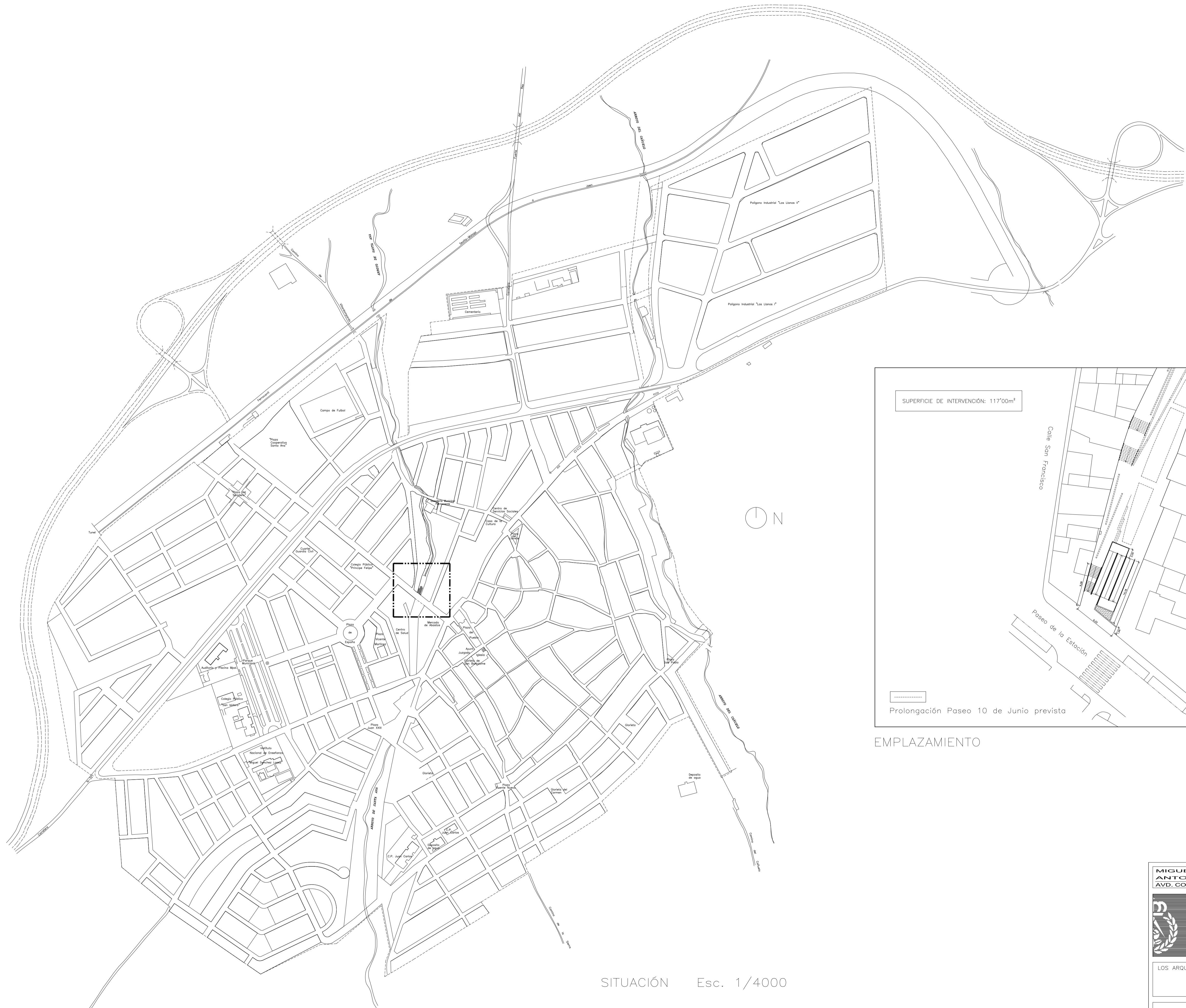
SITUACIÓN Esc. 1/4000